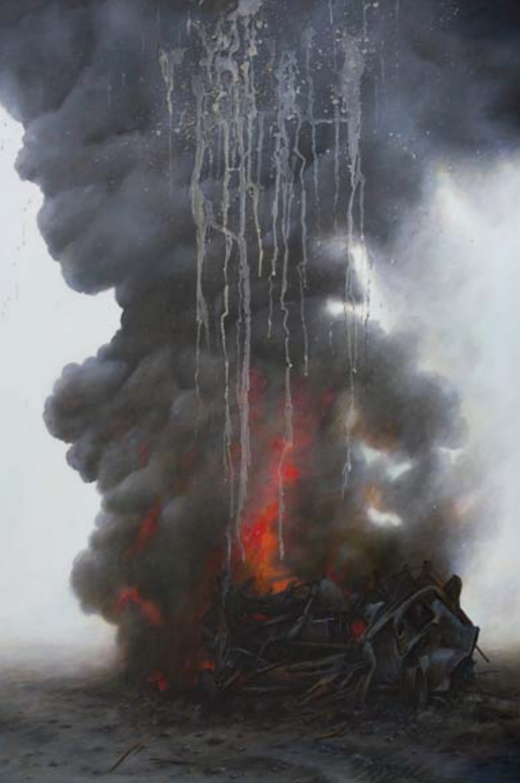
Ego 2, 2015, Acryl / Leinwand, 100 x 80 cm Anschlag 1, 2013, Acryl / Leinwand, 150 x 105 cm

Bilder von Robert Schneider: © VG Bild-Kunst, Bonn 2018